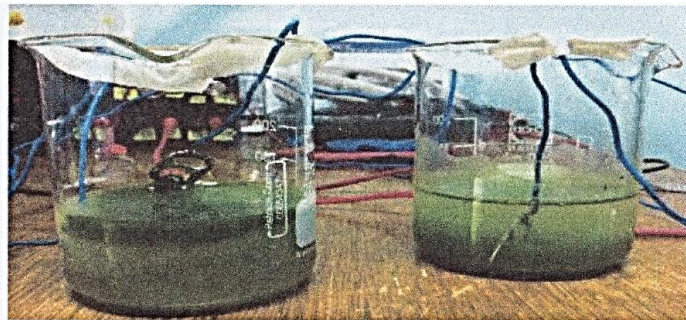
Précipitation de sels en solution par hydro-électrolyse !

La Bobine produit naturellement par électrolyse une précipitation des sels en solution. Il est donc tout à fait normal que, même sans la présence des pieds ou des mains, il se produise un précipité dans l'eau et l'apparition d'une boue plus ou moins noire, en fonction des sels présents dans l'eau (quantité, qualité, spécificité).